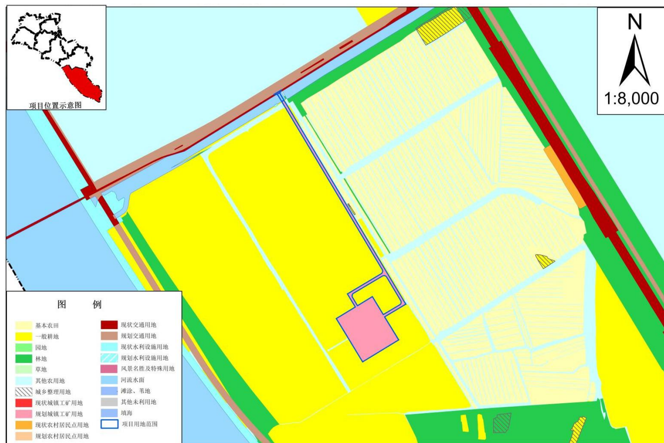
项目区土地利用总体规划图（修改后）