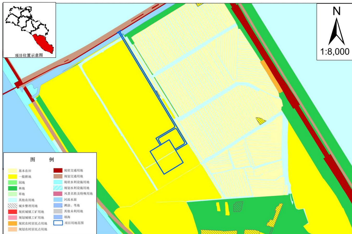
项目区土地利用总体规划图（修改前）